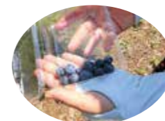
黒い真珠のような大粒のブルーベリー!