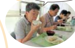
昼食は、手作りの温かい給食です。