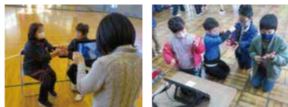
駒馬台小学校の児童と愛宕地区民生委員児童委員の皆さんによる遊び交流