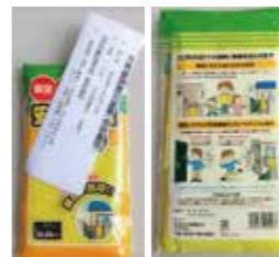
訓練で使用するタオル(写真左)表面(写真右)裏面