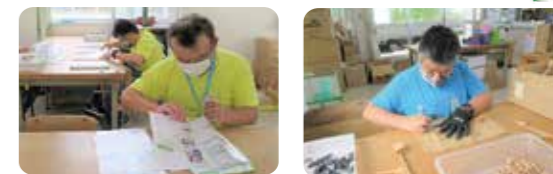
しゃきょうだより仕上げ作業