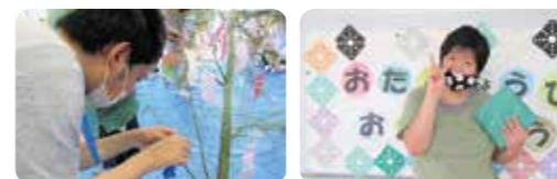
季節の行事(七夕集会)