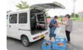
福祉の店移動販売実習