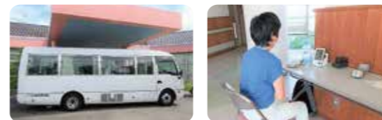
送迎車内も消毒を徹底しています。