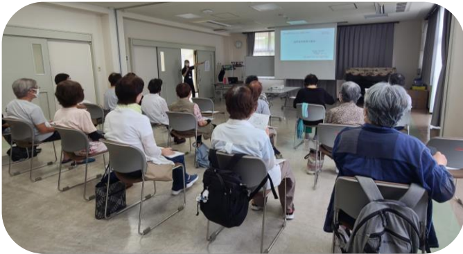
成年後見制度について講習会